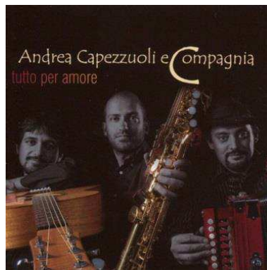
Tutto per amore, 2009